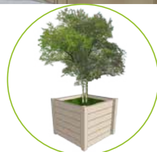
Bac créatif pour arbuste 104 x 104 x 92 cm

Là où il est impossible de planter des arbres ou des arbustes en pleine terre, utilisez de grands pots ou des bacs.