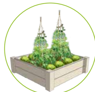
Carré potager 104 x 104 x 32 cm